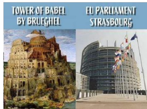
Toren van Babel